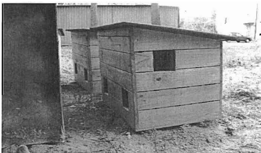
Przykładowe zdjęcie budki dla kotów